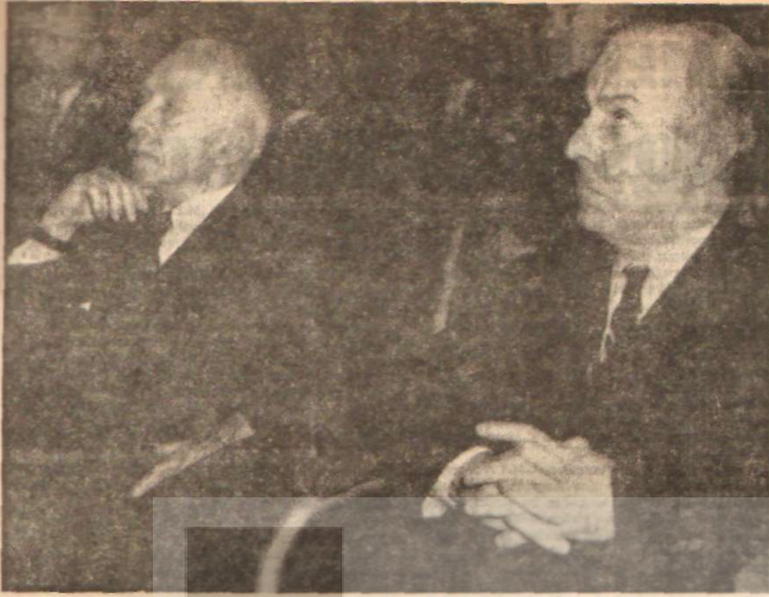
Yeni Başbakan Suat Hayri Uğurlu ve C.H.P. Genel Başkanı İnönü

tan sonra verdiği beyanat şeklin- de yayınladı. Bu korkunç beyanat, hâlâ ne