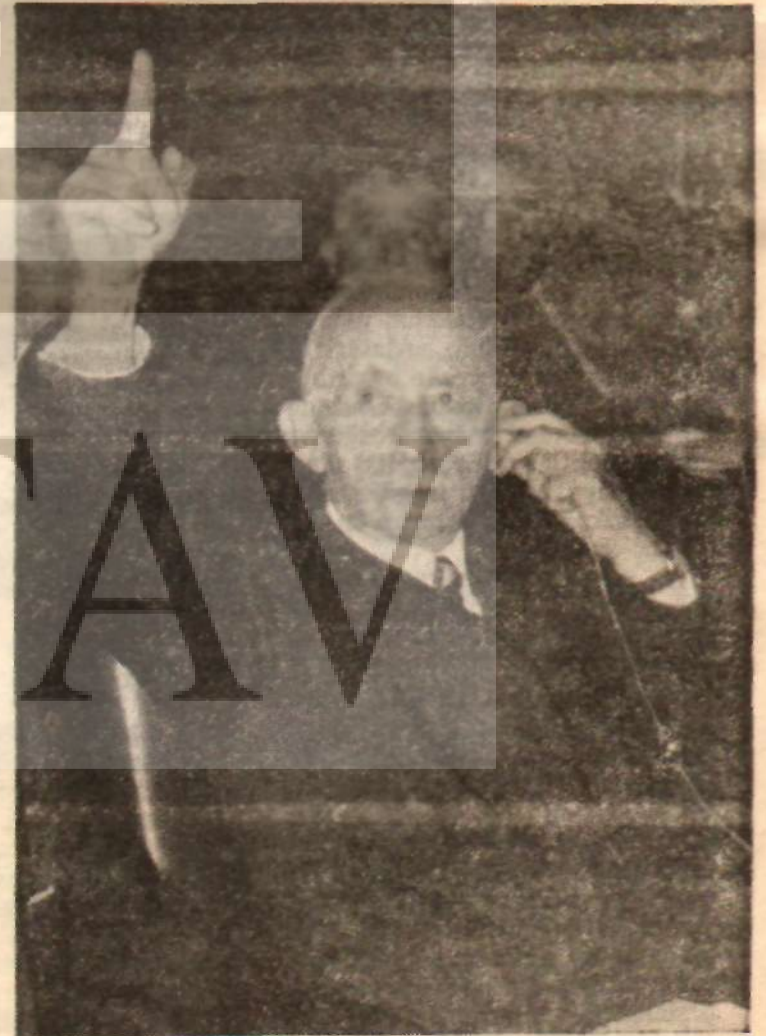
İnönü, düşürüldüğü gün Mecliste «Söz istiyorum!..»

Beyanat bomba gibi patladı. Akşam gazetesi, bunu Oğuz'un Amerikalı Büyükelçisi ile konuştuğ-