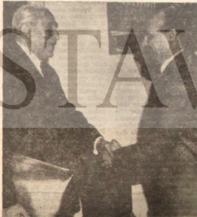
A.P. Genel Başkanı Demirel, M.P. Genel Başkanı İnönü ile «Happy end!».

«Toprak Reformuna uzun çalışmalar sonunda Meclise getirmeye muvaffak olduk. Madelerinizden her toprak reformuna taraftar olduğuna inanıyoruz. Toprak Reformuna çıkarmak için ameli bir tedbir olarak bir karma komisyon teşkil edilmesini fikrinin kabul bu burmadır. Bu kanunun Türk köylüsünün imdadına yetişmesini uygun görmediniz. Yedi komisyon da tetkik her halde bu devrede geçilecektir. Bu noktayı başta müteessir olduğumuz mesele